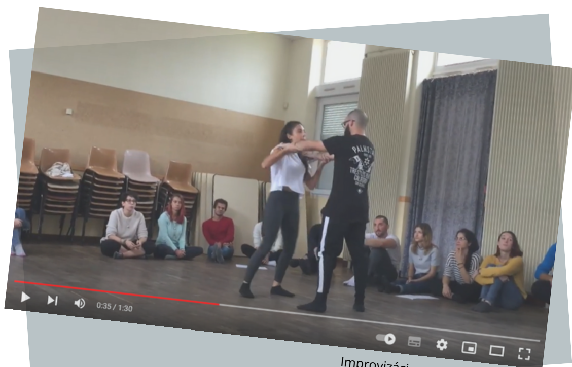
Improvizácia vo Francúzsku, 2019