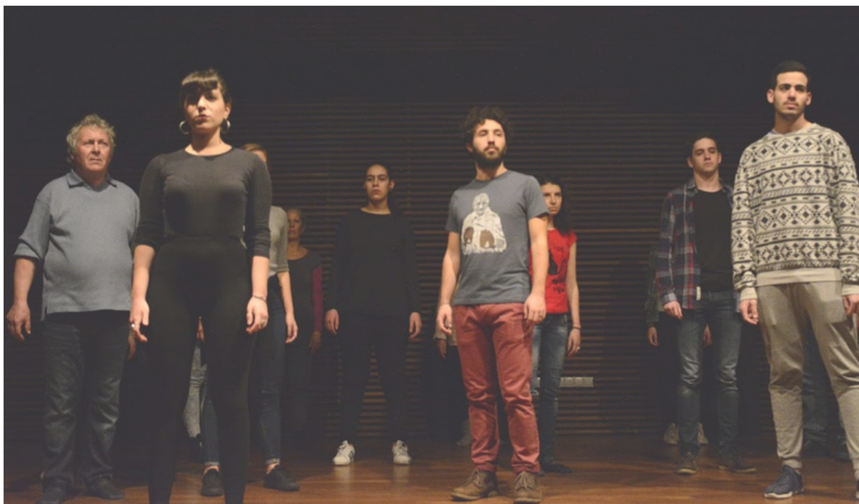
Pilotné stretnutie A.N.T.Y.G.O.N.E. vTaliansku

Teatro alla Guilla uskutočnilo pilotné sedenia formou, akou to robí od roku 2016. Pri aktuálnych pilotných stretnutiach Teatro alla Guilla splnilo stanovené úlohy a uvedomilo si, ktoré veci sa majú zlepšiť a umožniť hladký priebeh. Školiteľ strávil prvú polovicu prvej časti prvého sedenia tým, že nechal účastníkov predstaviť sa, priblížiť ich pozadie a spoločné záľuby. Bol to spôsob, ako prelomiť ľady, hovoriť o sebe a počúvať ostatných. Druhá polovica sa týkala témy workshopu a účastníci o nej čo najdlhšie debatovali. Školiteľ pracoval na dráme Antigona, pričom vychádzal z debaty o dvoch uhloch pohľadu (Kreón a Antigona), ktoré porovnával s európskymi štátmi, s ich zákonmi a občanmi, ktorí chcú pomôcť migrantom a ľuďom, ktorí utekajú pred vojnou a chudobou. Teatro alla Guilla začalo prípravou improvizácie s týmito dvoma postavami a zborom.