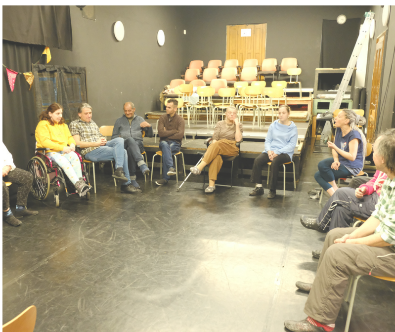
Pilotné stretnutie A.N.T.Y.G.O.N.E. v Pisztoryho paláci, Bratislava, Slovensko

Táto metóda umožňuje ľuďom s rôznymi formami telesného alebo mentálneho postihnutia tvoriť umenie. Môžu ju využívať aj ľudia s poruchami reči alebo ľudia, ktorí nehovoria jazykom krajiny, v ktorej žijú. Metóda sa zameriava na určité momenty divadelnej hry a ponúka tak divadelné príležitosti ľuďom, ktorí nemajú herecké vzdelanie ani skúsenosti. Každému a každej prináša možnosť zapojiť sa do umeleckej tvorby takým spôsobom, ktorý je pre ňu prijateľný a vhodný.