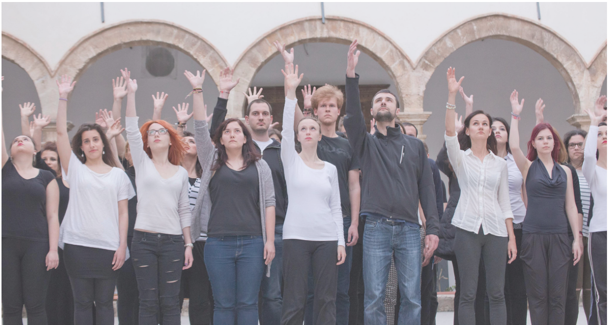
A.N.T.Y.G.O.N.E. skúška počas úplne prvého pilotného stretnutia, Palermo, Taliansko, 2016

Úvodná vzdelávacia aktivita – Learning Training and Teaching Activity (LTTA) v rámci projektu A.N.T.Y.G.O.N.E. – sa uskutočnila v Palerme (IT) v októbri 2022, na mieste, kde vznikol samotný projekt A.N.T.Y.G.O.N.E. Celý workshop bol realizovaný pod vedením partnerskej organizácie Teatro alla Guilla, ktorá túto metódu prvýkrát rozvinula v roku 2016, keď Teatro alla Guilla zorganizovalo v Palerme svoju prvú mládežnícku výmenu so 60 mladými ľuďmi z celej Európy a prvýkrát použilo metódu A.N.T.Y.G.O.N.E.