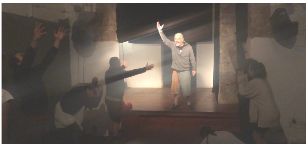
Train-the-Trainers v Palerme, Taliansko, október 2022

4/ Poslednou vecou pri workshope A.N.T.Y.G.O.N.E., ktorú je dobré vedieť je, čo účastníci ako školitelia/facilitátori robia vo svojom profesionálnom živote, či už sú sociálni pracovníci alebo umeleckí vedúci, učitelia alebo umelci. Vďaka tomu si školitelia môžu prispôbiť metodiku vhodným spôsobom pred začiatkom workshopu.