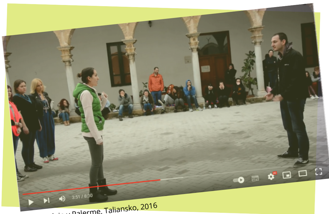
Improvizácia v Palerme, Taliansko, 2016