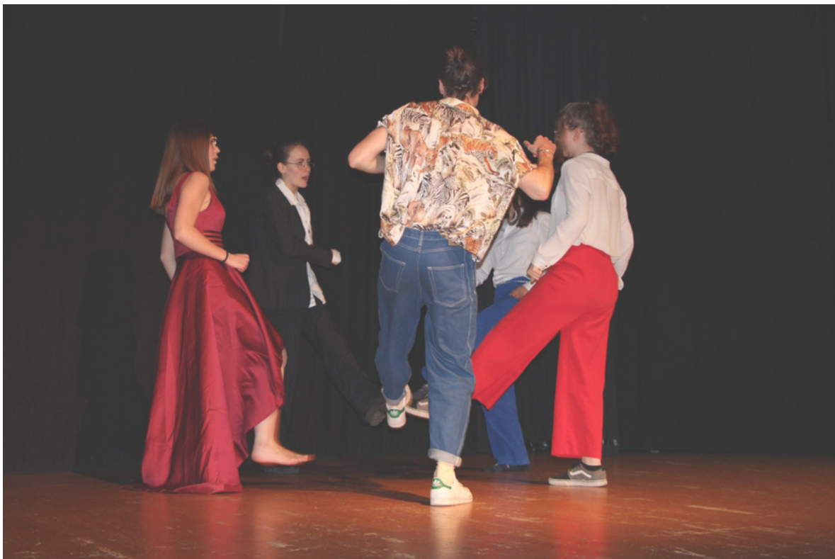
Pilotné stretnutie A.N.T.Y.G.O.N.E. v Maison des Jeunes et de la Culture d'Annecy (74), Francúzsko

Slabšími stránkami pilotného stretnutia bola podpora účastníkov a vrátenie im sebadôvery, keď im počas niektorých improvizovaných cvičení chýbala inšpirácia. To bolo niekedy pre oboch školiteľov ťažké zvládnuť.