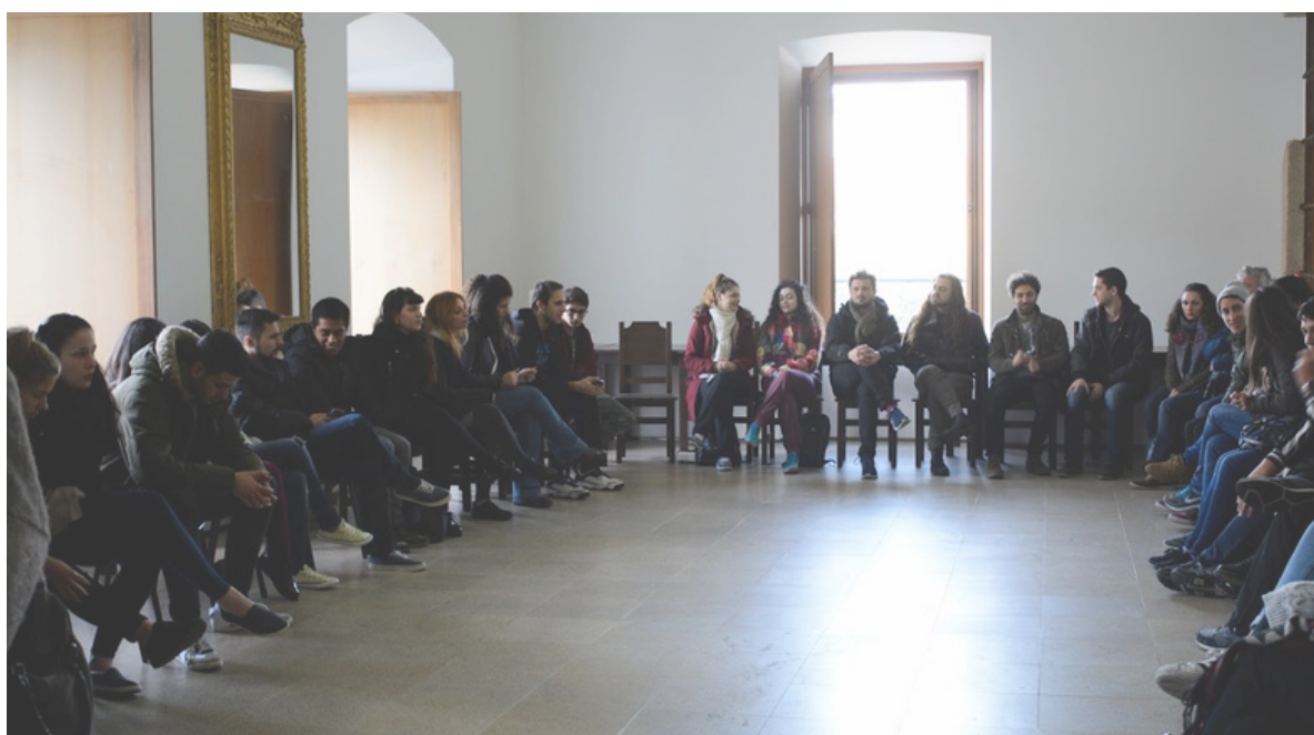
Metóda A.N.T.Y.G.O.N.E. – 1. deň, Palermo, Taliansko, 2016