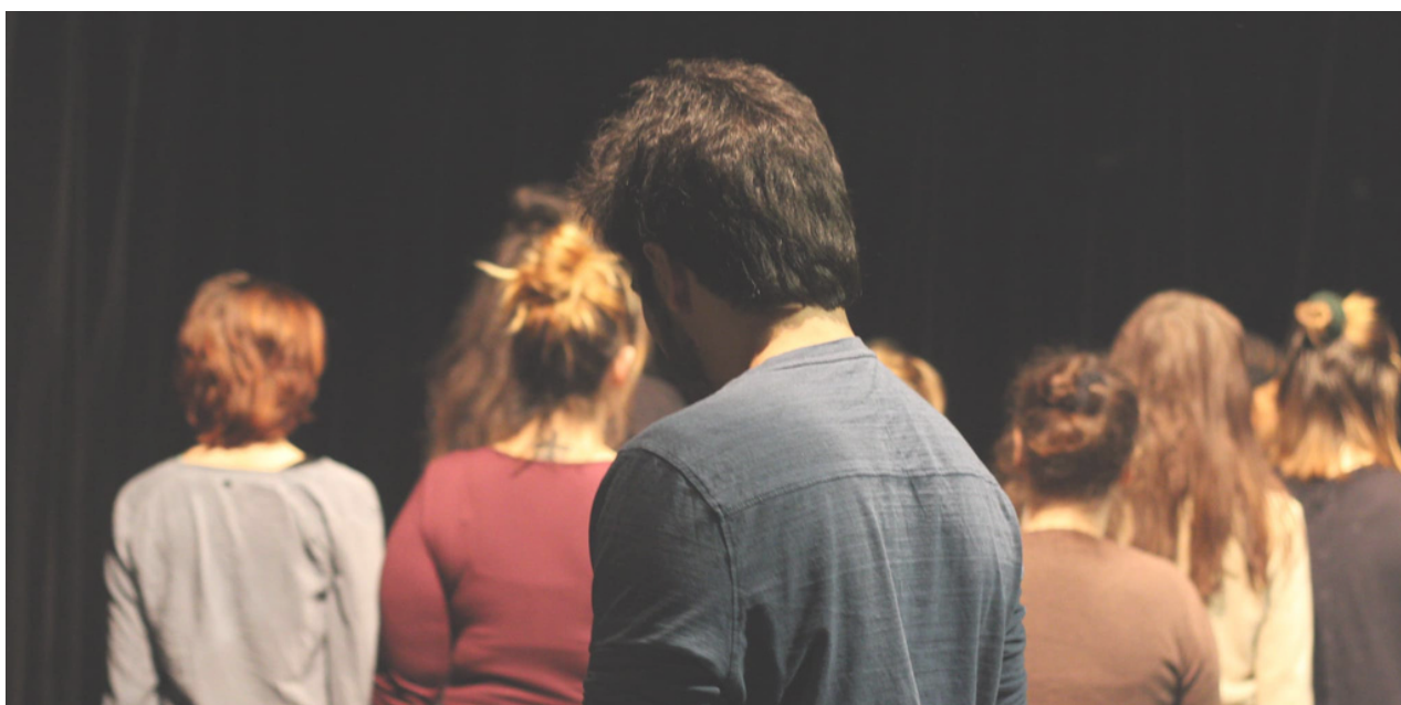
Pilotné stretnutie A.N.T.Y.G.O.N.E. v Théâtre La Girandole, Montreuil (93), Francúzsko