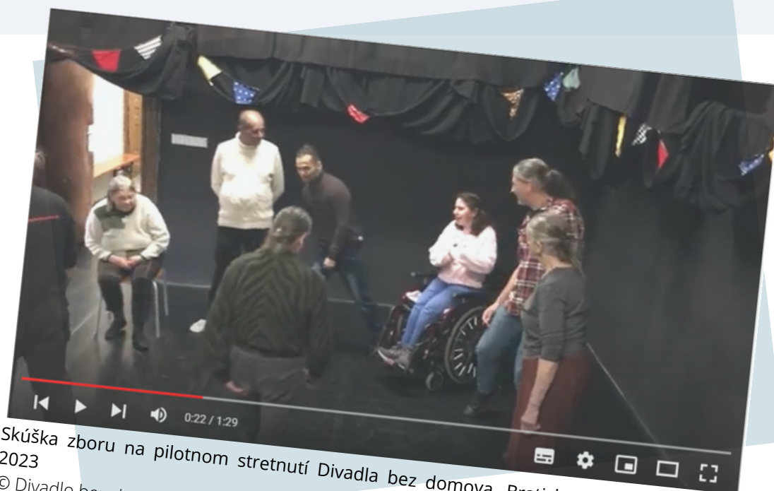
Skúška zboru na pilotnom stretnutí Divadla bez domova, Bratislava, Slovensko, január 2023

2/ Ďalším krokom je preklad celého dialógu medzi Kreónom a Antigonou do materinského jazyka účastníkov . Účastníci venujú potrebný čas analýze a diskusii o jednotlivých replikách. Používanie vlastného jazyka je spôsob, ako preniknúť hlbšie do textu a pochopiť jeho význam lepšie ako predtým.