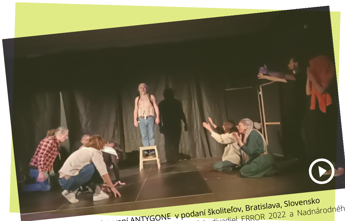
Postava Kreóna v predstavení ANTYGONE v podaní školiteľov, Bratislava, Slovensko V rámci Medzinárodného festivalu bezdomoveckých divadiel ERROR 2022 a Nadnárodného projektového stretnutia.

Improvizovať môžeme aj s postojmi zboru . Takže všetci účastníci (okrem dvoch, ktorými sú Antigona a Kreón) začnú pracovať na nálade zboru. Improvizácia sa týka zboru a jeho správania, reakcií, keď Kreón prichádza na hlavné námestie Théb a keď prichádza Antigona v sprievode stráží.